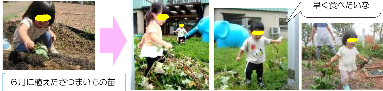
6月に植えたさつまいもの苗が立派に成長しました！

9月の終わりにさつまいもの収穫をしました。長く伸びたツルを刈ると、みんなせっせとツルを運んで職員のお手伝いをしてくれました。お手伝いが大好きな子ども達です。